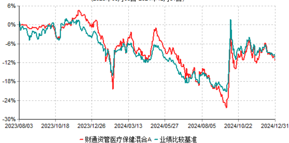
财通资管医疗保健混合A累计净值增长率与业绩比较基准收益率历史走势对比图 (2023年08月03日-2024年12月31日)