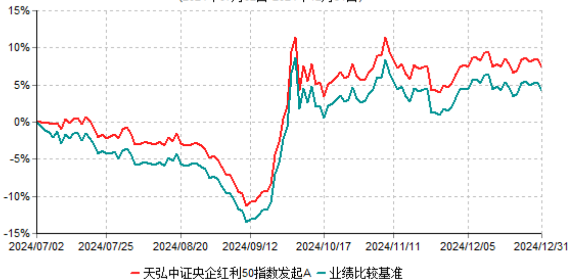
天弘中证央企红利50指数发起A累计净值增长率与业绩比较基准收益率历史走势对比图 (2024年07月02日-2024年12月31日)