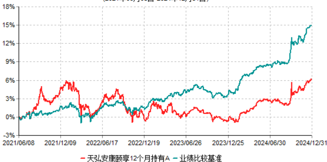
天弘安康颐享12个月持有A累计净值增长率与业绩比较基准收益率历史走势对比图 (2021年06月08日-2024年12月31日)