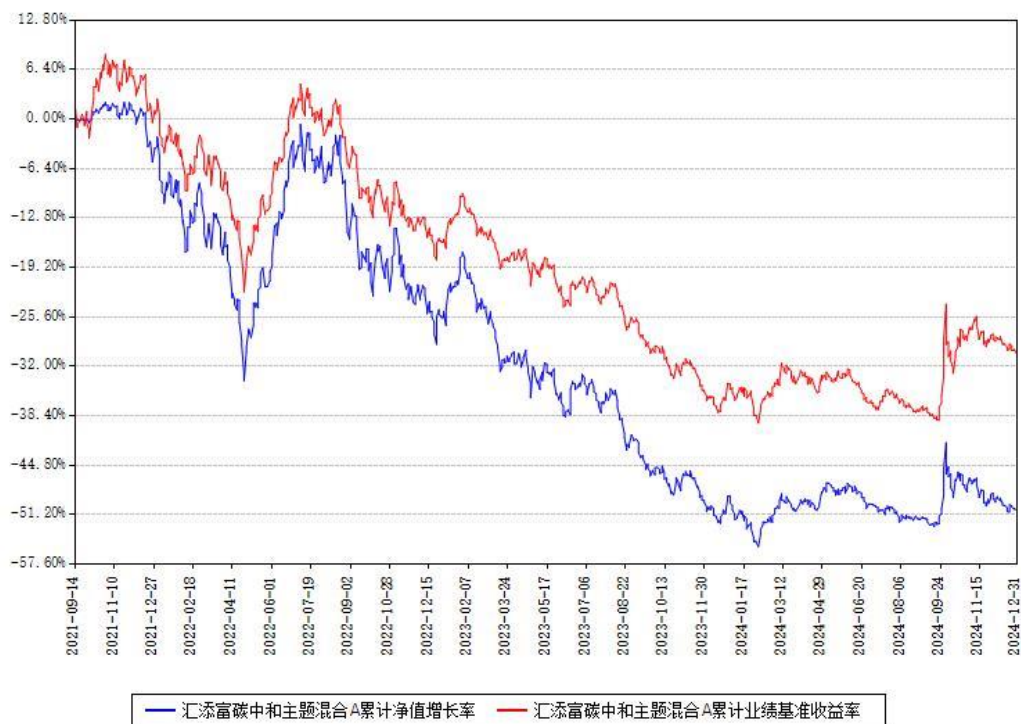
汇添富碳中和主题混合A累计净值增长率与同期业绩基准收益率对比图