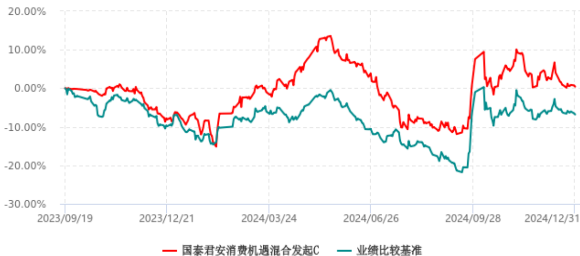
国泰君安消费机遇混合发起C累计净值增长率与业绩比较基准收益率历史走势对比图 (2023年09月19日-2024年12月31日)

注：按基金合同和招募说明书的约定，本基金的建仓期为六个月，建仓期结束时各项资产配置比例符合基金合同的有关约定。