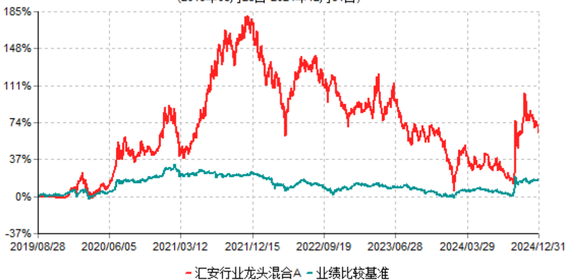
汇安行业龙头混合A累计净值增长率与业绩比较基准收益率历史走势对比图 (2019年08月28日-2024年12月31日)