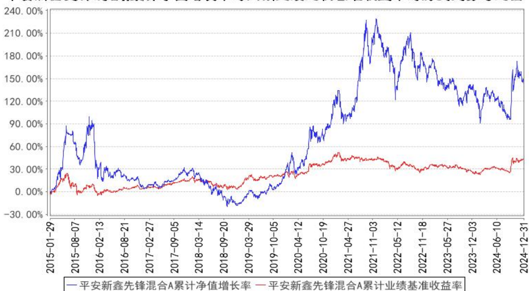
平安新鑫先锋混合A累计净值增长率与同期业绩比较基准收益率的历史走势对比图