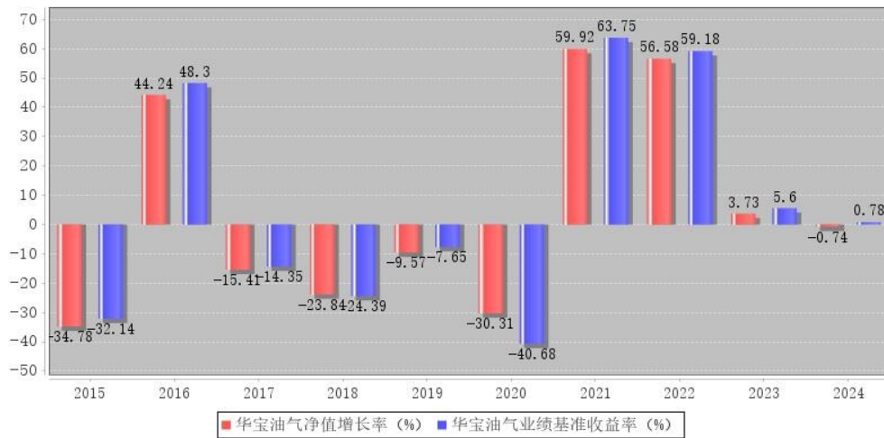
华宝油气每年净值增长率与同期业绩比较基准收益率的对比图