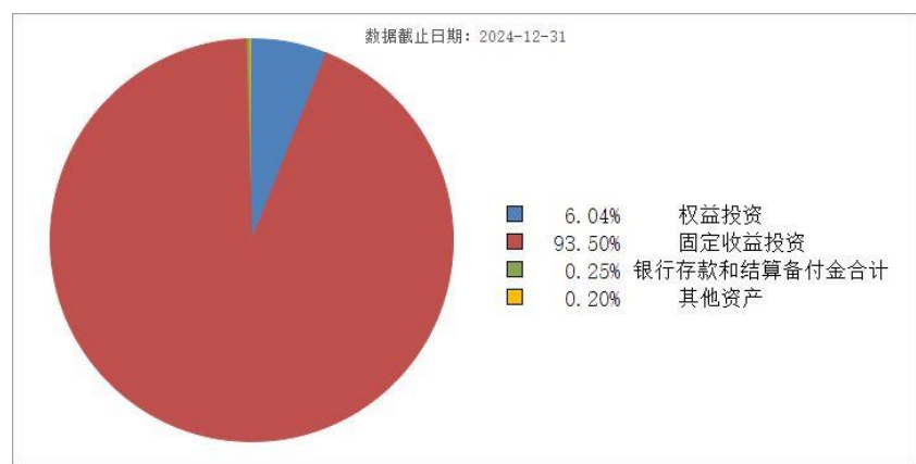
投资组合资产配置图表