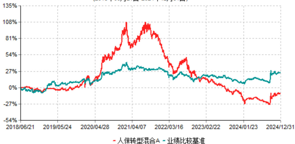
人保转型混合A累计净值增长率与业绩比较基准收益率历史走势对比图 (2018年06月21日-2024年12月31日)