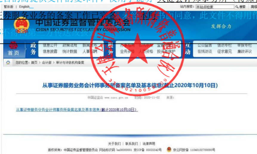
从事证券服务业务会计师事务所名单

仅为广西双英集团股份有限公司向不特定合格投资者公开发行股票并在北京证券交易所上市之目的而提供文件的复印件，仅用于说明天健会计师事务所（特殊普通合伙）从事证券服务业务的备案工作已完备，未获本所书面同意，此文件不得用作任何其他用途，亦不得用于其他任何目的。