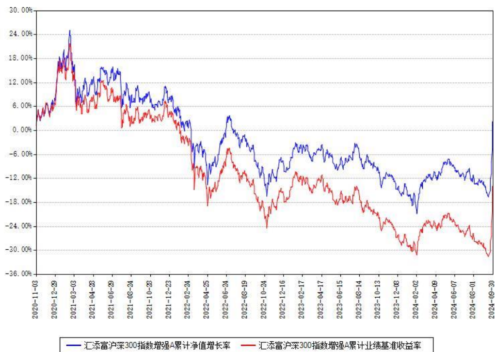
汇添富沪深300指数增强A累计净值增长率与同期业绩基准收益率对比图