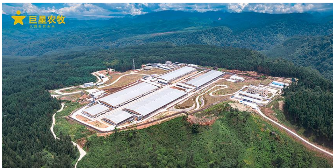
图 1：巨星农牧现代化平层猪场