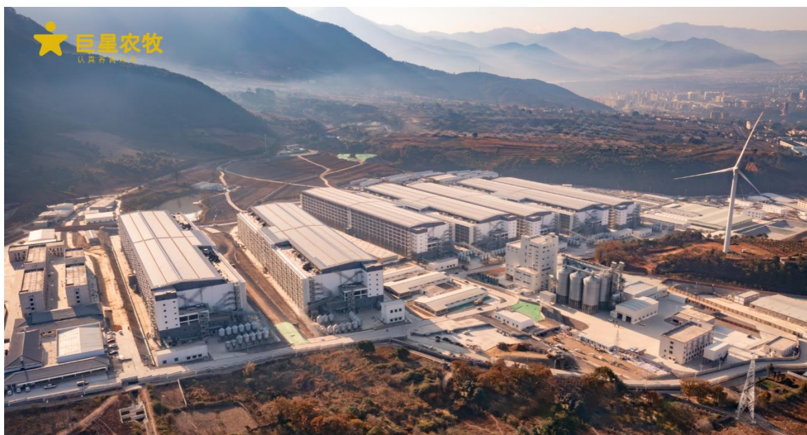
图 2：巨星农牧现代化楼房猪场

此外，现代化生猪养殖行业已从传统的育肥逐渐延伸至集基因筛选、种猪选育、动物疫病防治、科学饲料配比等跨越多体系、多学科的系统性工程，市场参与者需综合考量育种效率、料肉转化率、日增重、病死率、饲料成本等多因素，不断提升养殖技术、优化养殖管理，并及时捕捉市场信息，对市场周期波动做出正确判断。生猪养殖行业已不再是简单的劳动密集型产业，养殖门槛的提升进一步加快我国生猪养殖行业现代化进程，助推我国生猪养殖行业向技术密集型、知识密集型产业的转型升级。