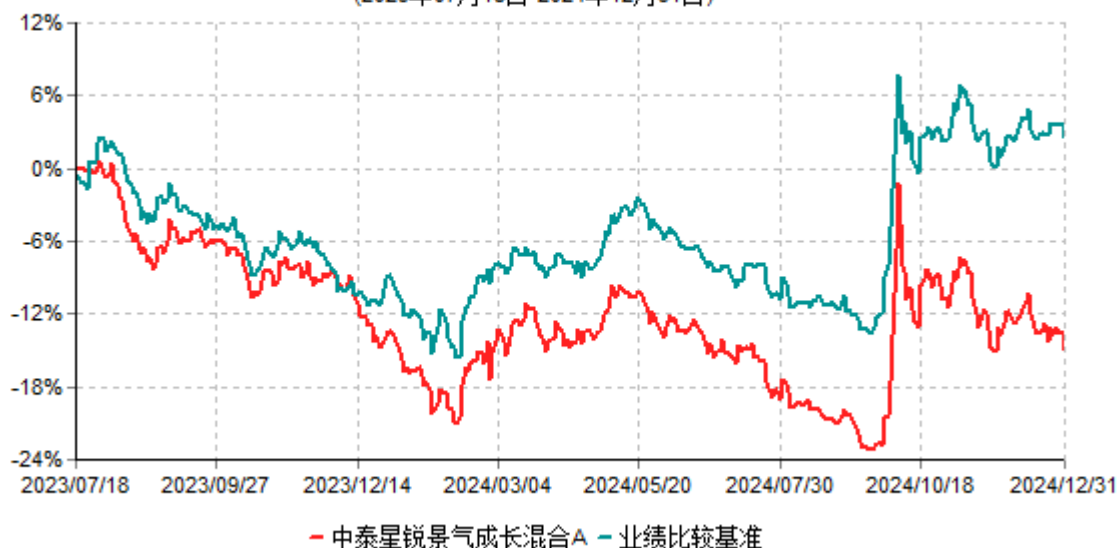
中泰星锐景气成长混合A累计净值增长率与业绩比较基准收益率历史走势对比图 (2023年07月18日-2024年12月31日)

注：根据基金合同约定，本基金自基金合同生效之日起6个月内为建仓期。建仓期结束时，本基金各项资产配置比例符合基金合同约定。