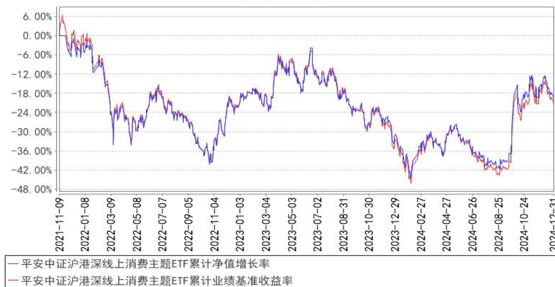
平安中证沪港深线上消费主题ETF累计净值增长率与同期业绩比较基准收益率的历史走势对比图