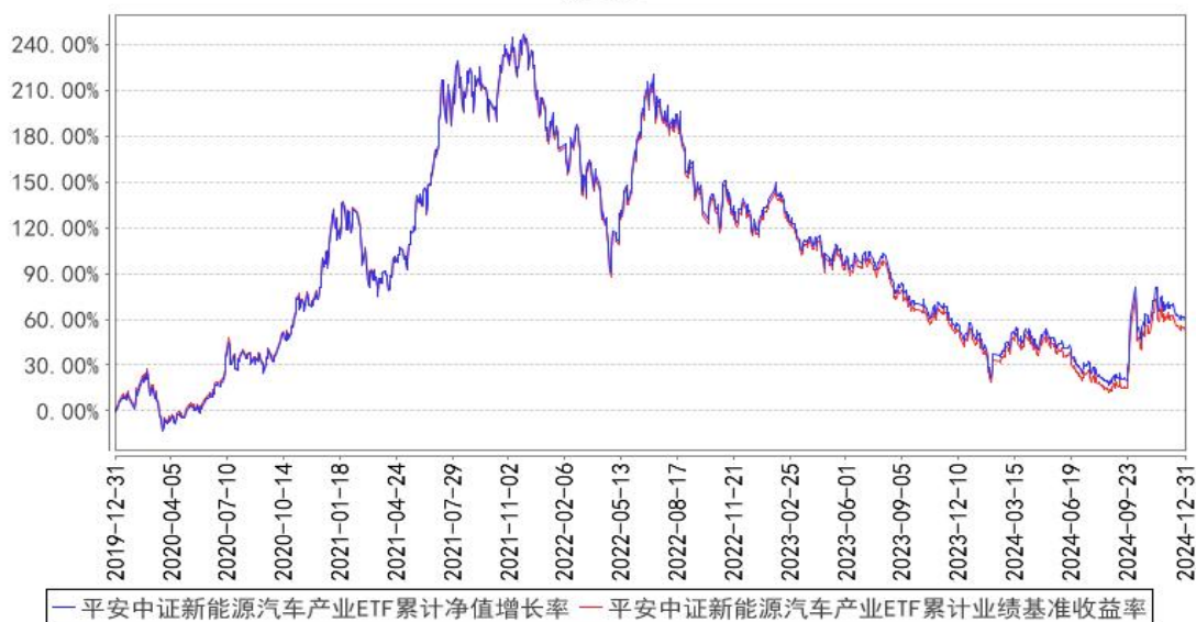
平安中证新能源汽车产业ETF累计净值增长率与同期业绩比较基准收益率的历史走势对比图