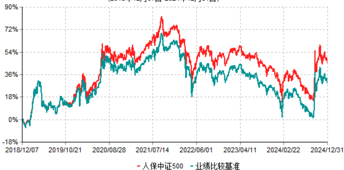
人保中证500累计净值增长率与业绩比较基准收益率历史走势对比图 (2018年12月07日-2024年12月31日)