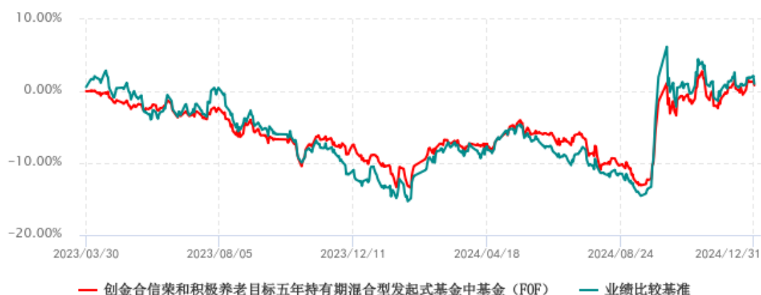
创金合信荣和积极养老目标五年持有期混合型发起式基金中基金（FOF）累计净值增长率与业绩比较基准收益率历史走势对比图 (2023年03月30日-2024年12月31日)