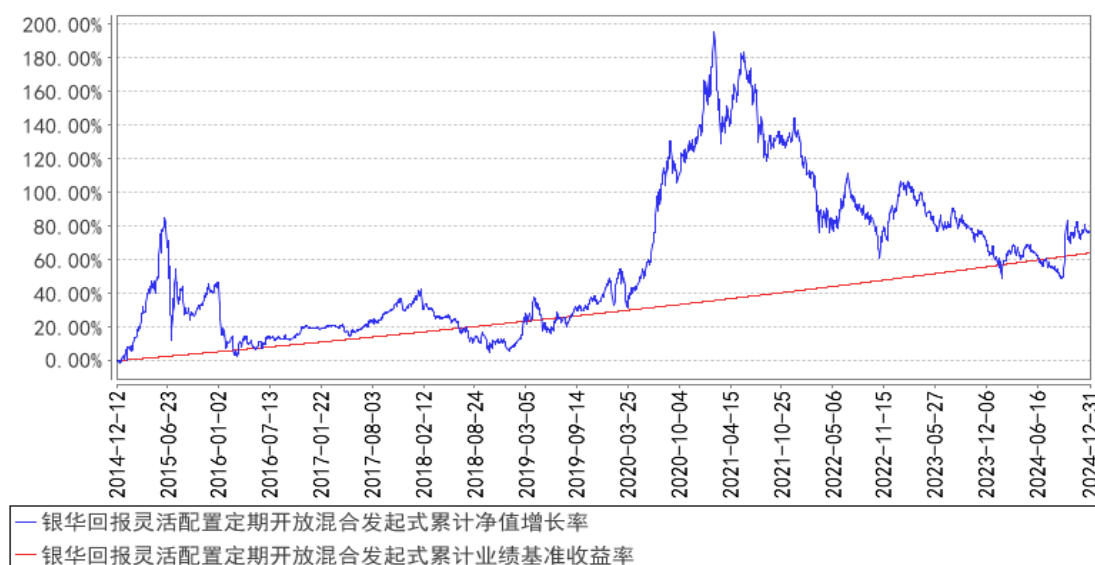
银华回报灵活配置定期开放混合发起式累计净值增长率与同期业绩比较基准收益率的历史走势对比图

注：按基金合同的规定，本基金自基金合同生效起六个月内为建仓期，建仓期结束时本基金的各项投资比例已达到基金合同的规定：股票投资比例为基金资产的 0%-95%；权证投资比例为基金资产净值的 0-3%；开放期内的每个交易日日终，在扣除股指期货合约需缴纳的交易保证金后，应当保持不低于基金资产净值 5%的现金或到期日在一年以内的政府债券。在封闭期内，本基金不受上述 5%的限制，但每个交易日日终在扣除股指期货合约需缴纳的交易保证金后，应当保持不低于交易保证金一倍的现金。其中，现金不包括结算备付金、存出保证金、应收申购款等。