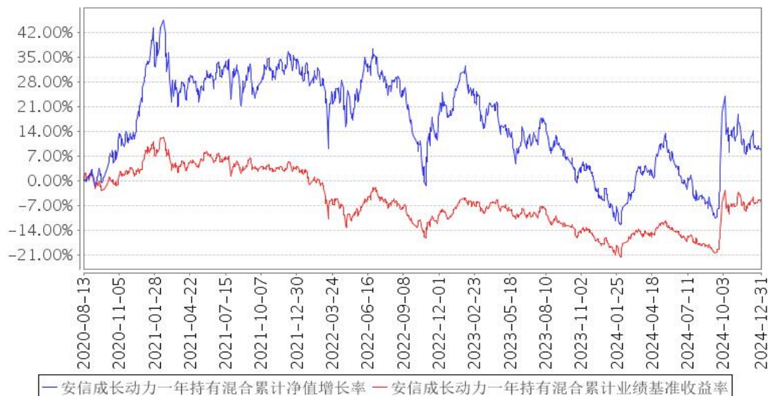
安信成长动力一年持有混合累计净值增长率与同期业绩比较基准收益率的历史走势对比图