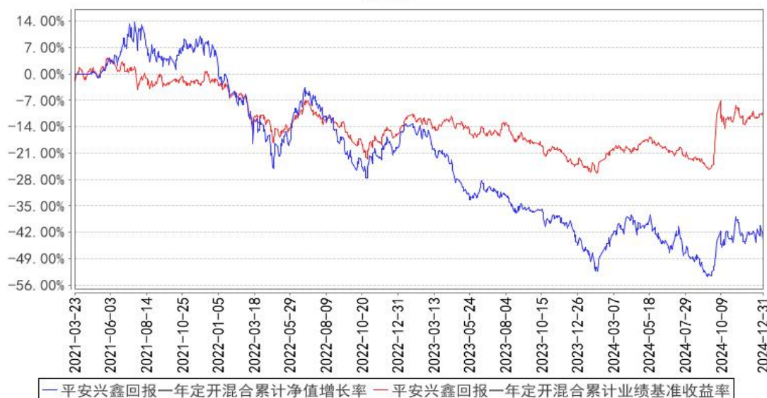
平安兴鑫回报一年定开混合累计净值增长率与同期业绩比较基准收益率的历史走势对比图