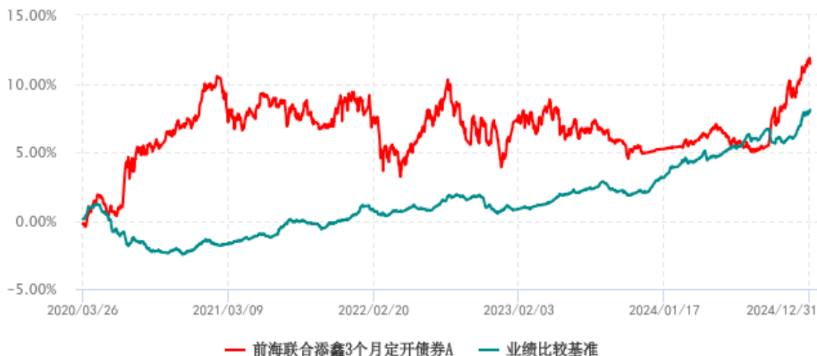
前海联合添鑫3个月定开债券A累计净值增长率与业绩比较基准收益率历史走势对比图 (2020年03月26日-2024年12月31日)