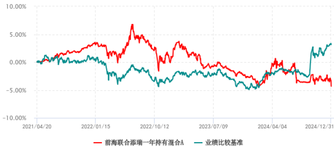
前海联合添瑞一年持有混合A累计净值增长率与业绩比较基准收益率历史走势对比图 (2021年04月20日-2024年12月31日)