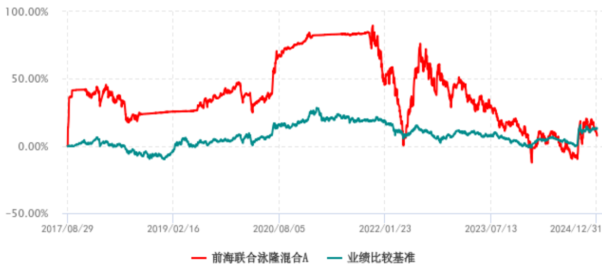
前海联合泳隆混合A累计净值增长率与业绩比较基准收益率历史走势对比图 (2017年08月29日-2024年12月31日)