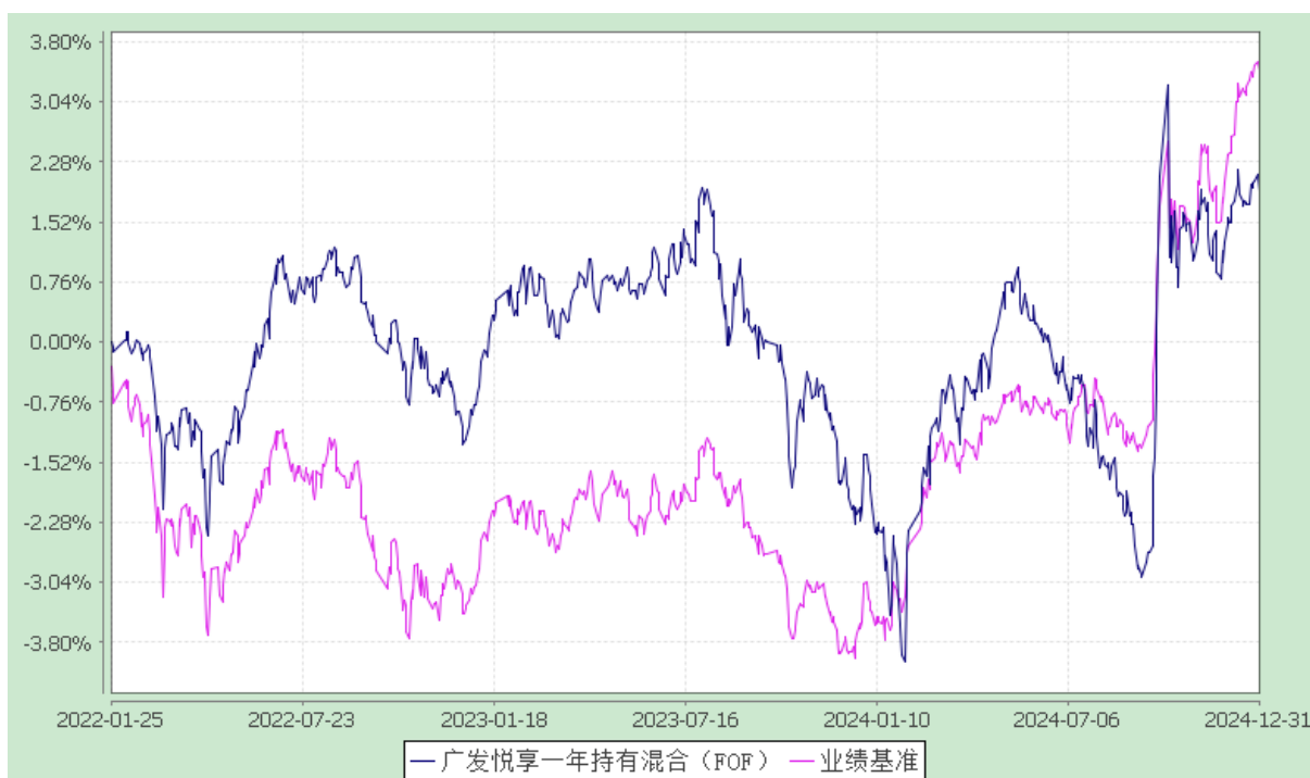
份额累计净值增长率与业绩比较基准收益率历史走势对比图 (2022 年 1 月 25 日至 2024 年 12 月 31 日)