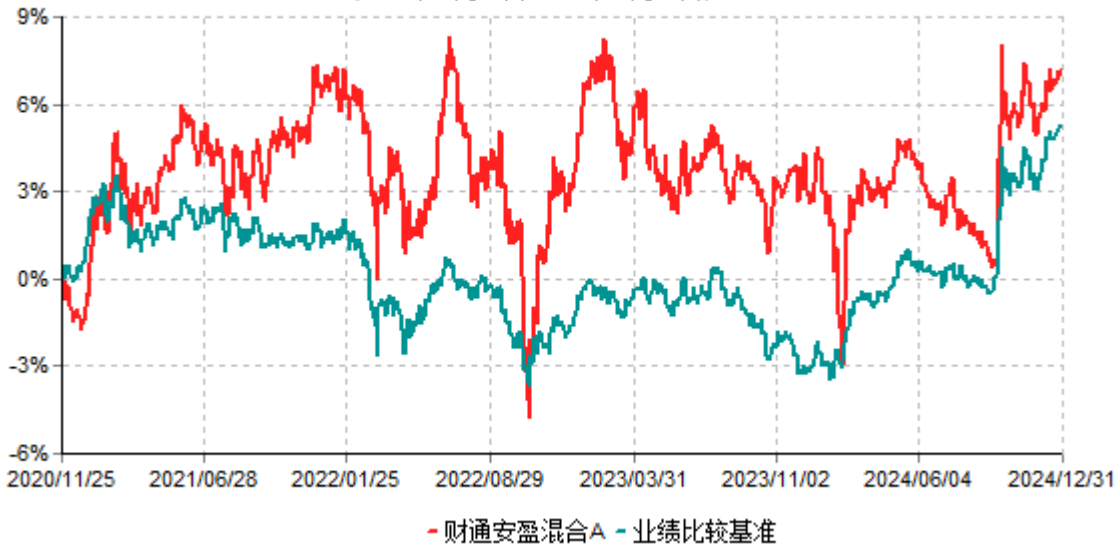
财通安盈混合A累计净值增长率与业绩比较基准收益率历史走势对比图 (2020年11月25日-2024年12月31日)