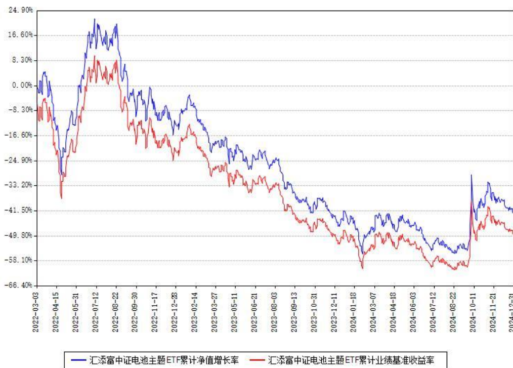
汇添富中证电池主题ETF累计净值增长率与同期业绩比较基准收益率对比图

注：本基金建仓期为本《基金合同》生效之日（2022年03月03日）起6个月，建仓期结束时各项资产配置比例符合合同约定。