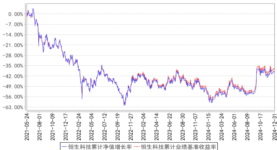
恒生科技累计净值增长率与同期业绩比较基准收益率的历史走势对比图

注：图示日期为 2021 年 5 月 24 日至 2024 年 12 月 31 日。