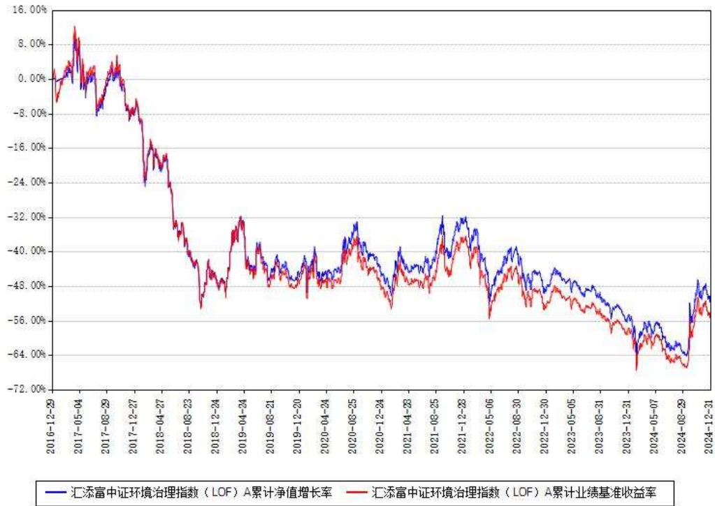
汇添富中证环境治理指数（LOF）A累计净值增长率与同期业绩基准收益率对比图