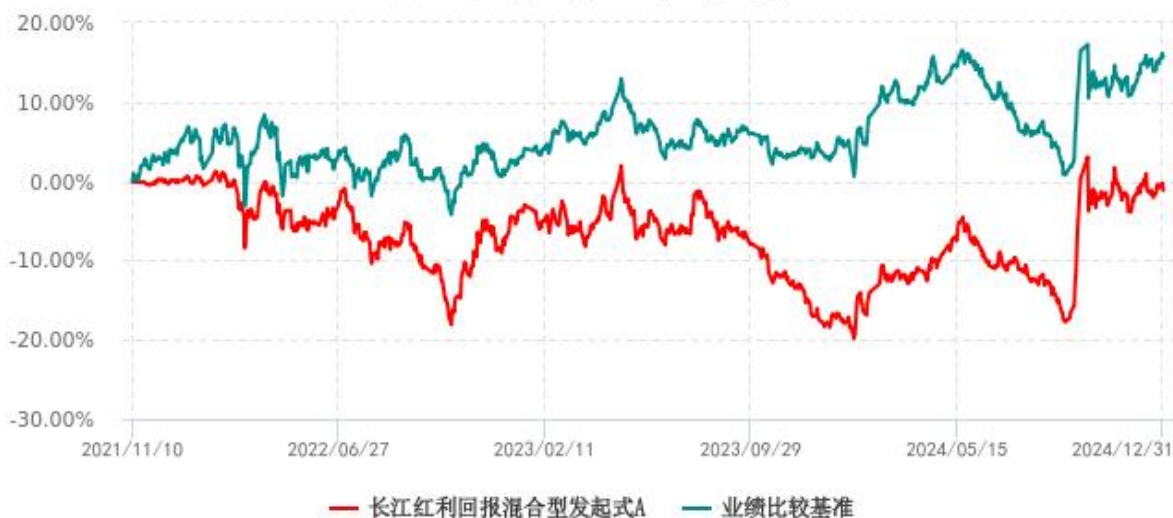
长江红利回报混合型发起式A累计净值增长率与业绩比较基准收益率历史走势对比图 (2021年11月10日-2024年12月31日)