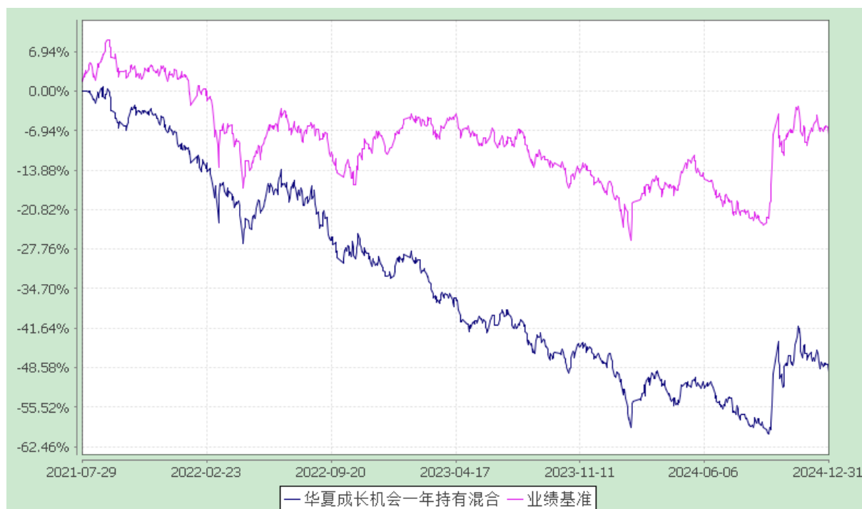
华夏成长机会一年持有期混合型证券投资基金 份额累计净值增长率与业绩比较基准收益率历史走势对比图 (2021 年 7 月 29 日至 2024 年 12 月 31 日)