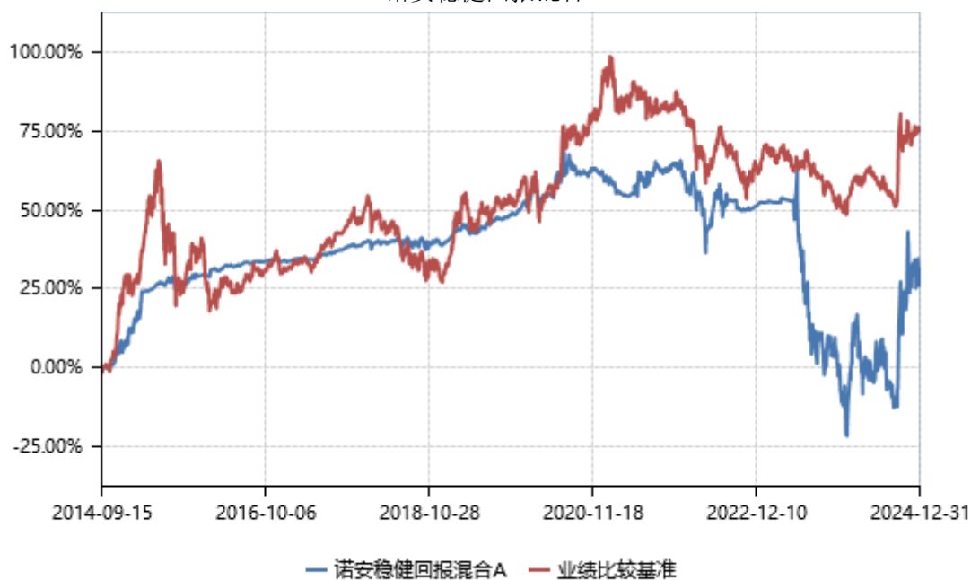
诺安稳健回报混合 A