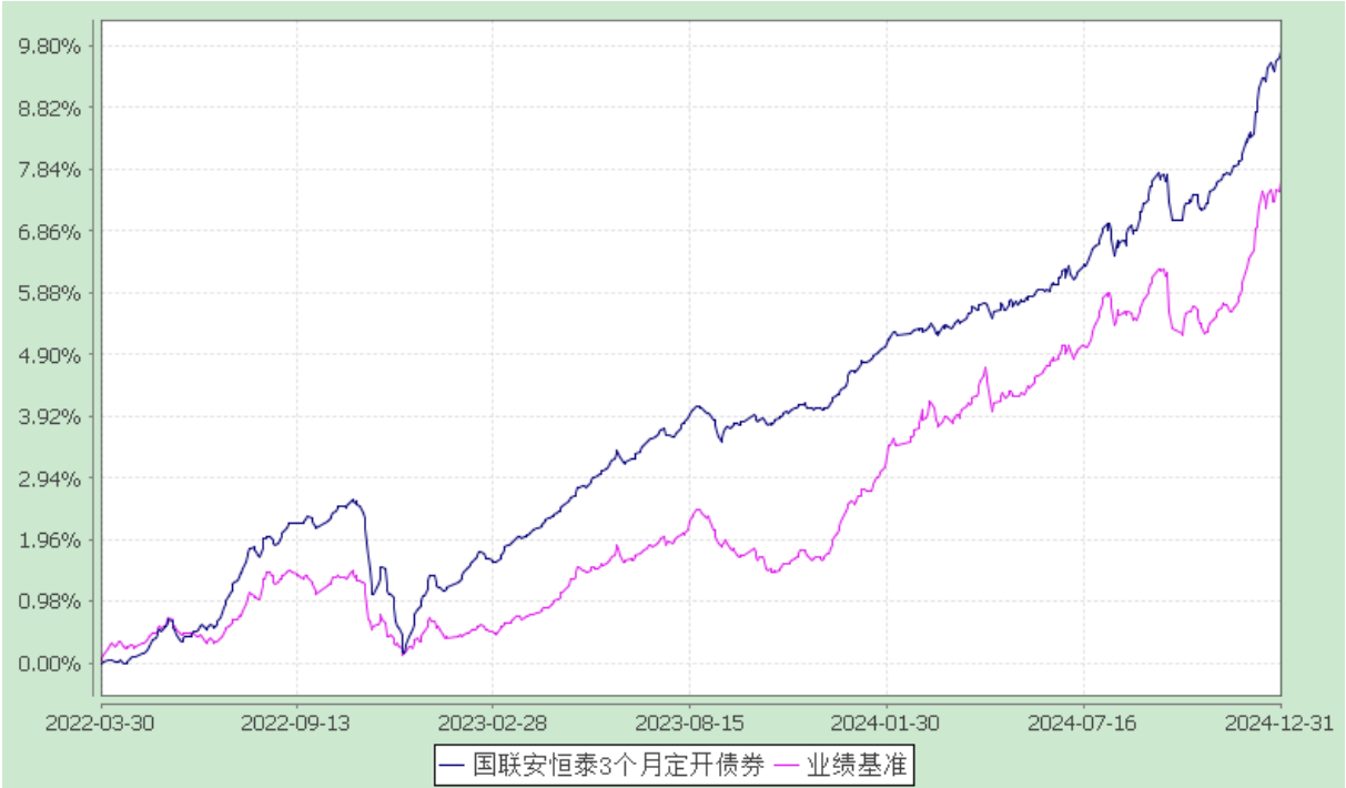
国联安恒泰 3 个月定期开放纯债债券型证券投资基金 自基金合同生效以来份额累计净值增长率与业绩比较基准收益率的历史走势对比图 (2022 年 3 月 30 日至 2024 年 12 月 31 日)

注：1、本基金业绩比较基准为中债综合指数收益率； 2、本基金基金合同于 2022 年 3 月 30 日生效； 3、本基金建仓期为自基金合同生效之日起的 6 个月，建仓期结束时各项资产配置符合合同约定。