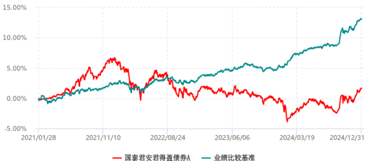
国泰君安君得盈债券A累计净值增长率与业绩比较基准收益率历史走势对比图 (2021年01月28日-2024年12月31日)