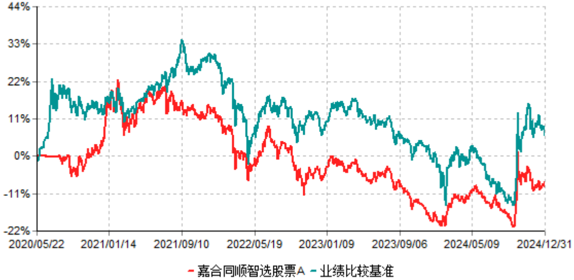
嘉合同顺智选股票A累计净值增长率与业绩比较基准收益率历史走势对比图 (2020年05月22日-2024年12月31日)