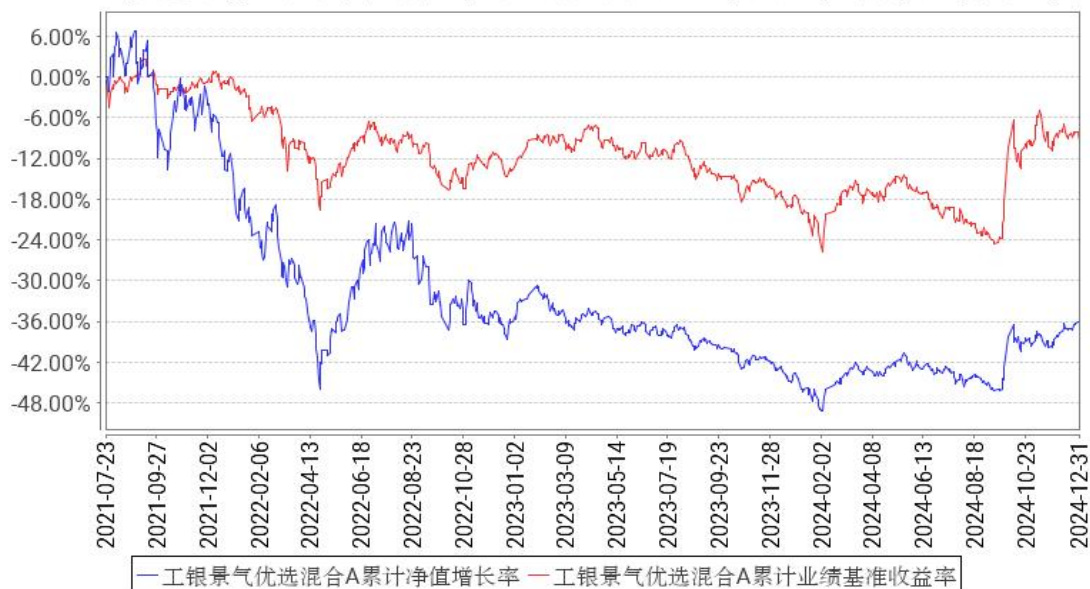
工银景气优选混合A累计净值增长率与同期业绩比较基准收益率的历史走势对比图