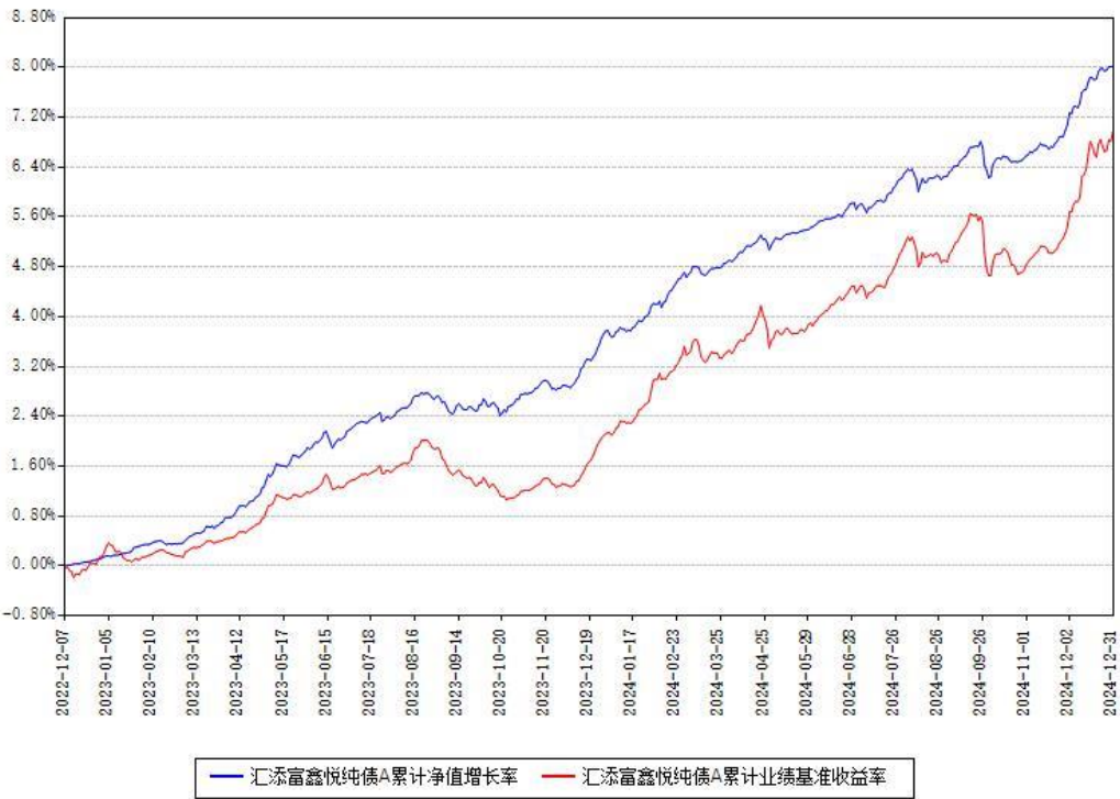
汇添富鑫悦纯债A累计净值增长率与同期业绩基准收益率对比图