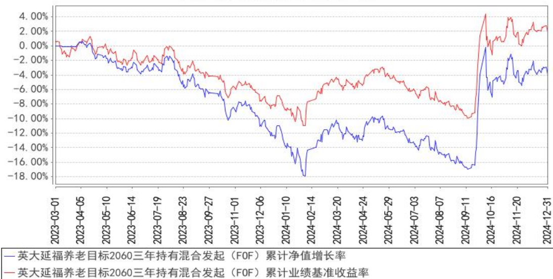
英大延福养老目标2060三年持有混合发起 (FOF) 累计净值增长率与同期业绩比较基准收益率的历史走势对比图

注：本基金的业绩比较基准为： (95\% \times \text{中证 800 指数收益率} + 5\% \times \text{中证港股通综合指数 (人民币) 收益率}) \times A\% + \text{中债综合全价 (总值) 指数收益率} \times (1-A\%) 。