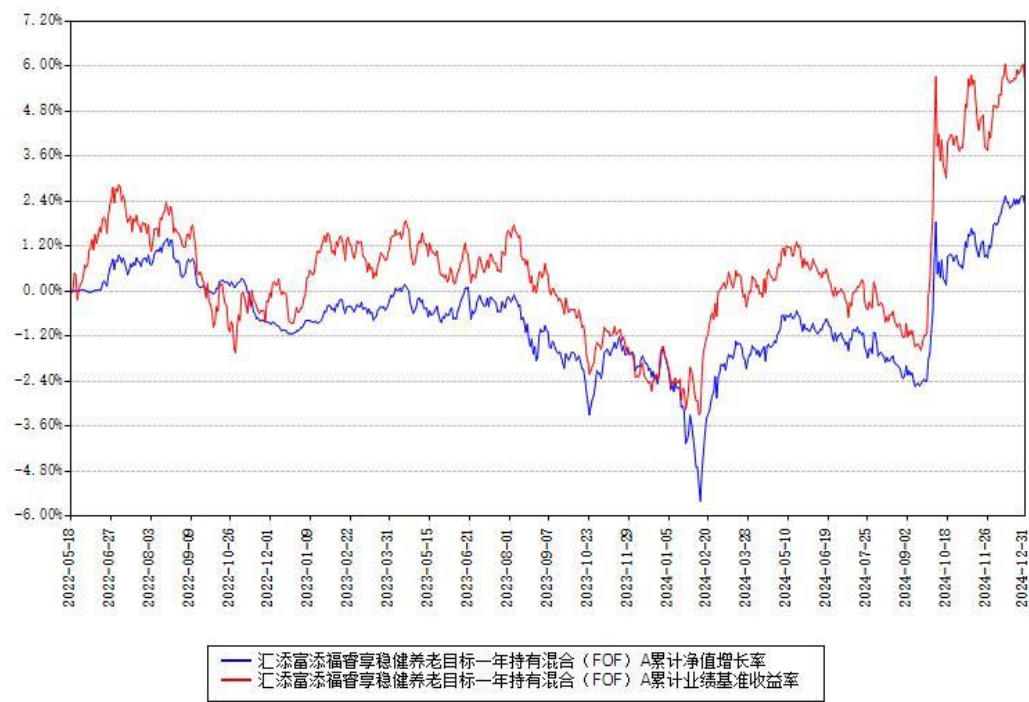
汇添富添福睿享稳健养老目标一年持有混合（FOF）A累计净值增长率与同期业绩比较基准收益率对比图