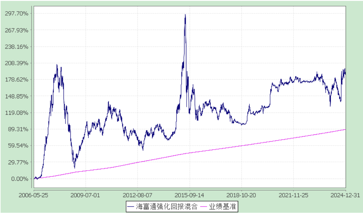
海富通强化回报混合型证券投资基金 份额累计净值增长率与业绩比较基准收益率的历史走势对比图 (2006 年 5 月 25 日至 2024 年 12 月 31 日)

注：按照本基金合同规定,本基金建仓期为基金合同生效之日起六个月。建仓期满至今,本基金投资组合均达到本基金合同第十二条(二)、(七)规定的比例限制及本基金投资组合的比例范围。