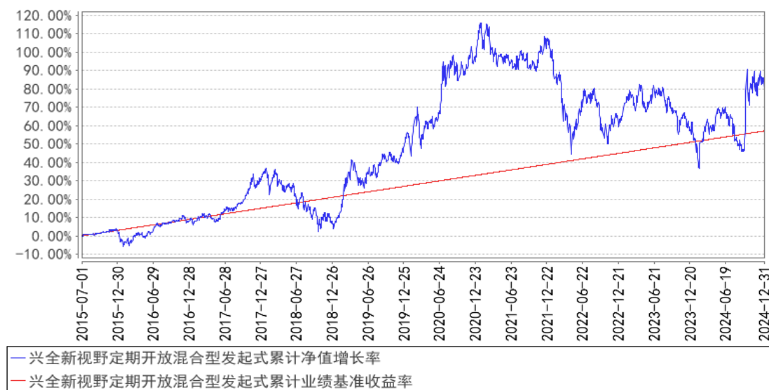
兴全新视野定期开放混合型发起式累计净值增长率与同期业绩比较基准收益率的历史走势对比图