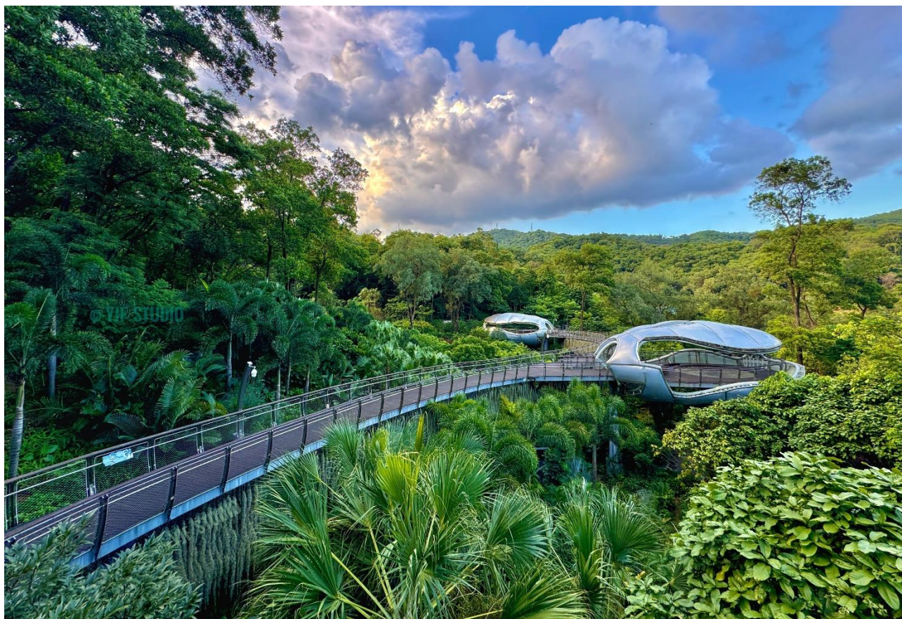
广州云萝花园绿化养护项目