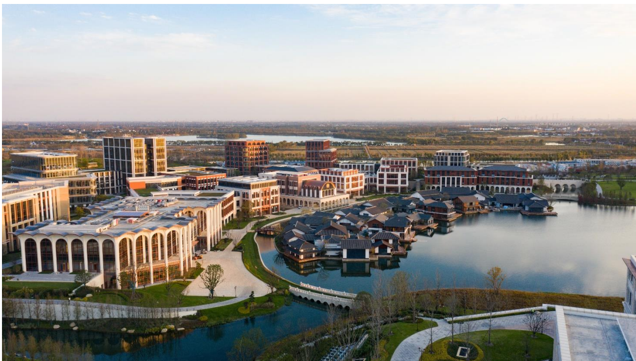
上海华为青浦研发中心项目

上海华为青浦研发中心坐落于上海市青浦区金泽镇，作为华为全球最大的研发基地，总景观面积达 38 万平方米，旨在打造全球最美园区典范。普邦股份承接了该项目 A、B、F 组团及 VIP 水镇区域的景观建设，精心打造了瀑布、拱桥、镜面水景、广阔草坪以及大面积弧形铺装等精品景观元素。通过专业设计与精湛施工，普邦股份充分展现了在高端企业园区景观营造方面的卓越实力。