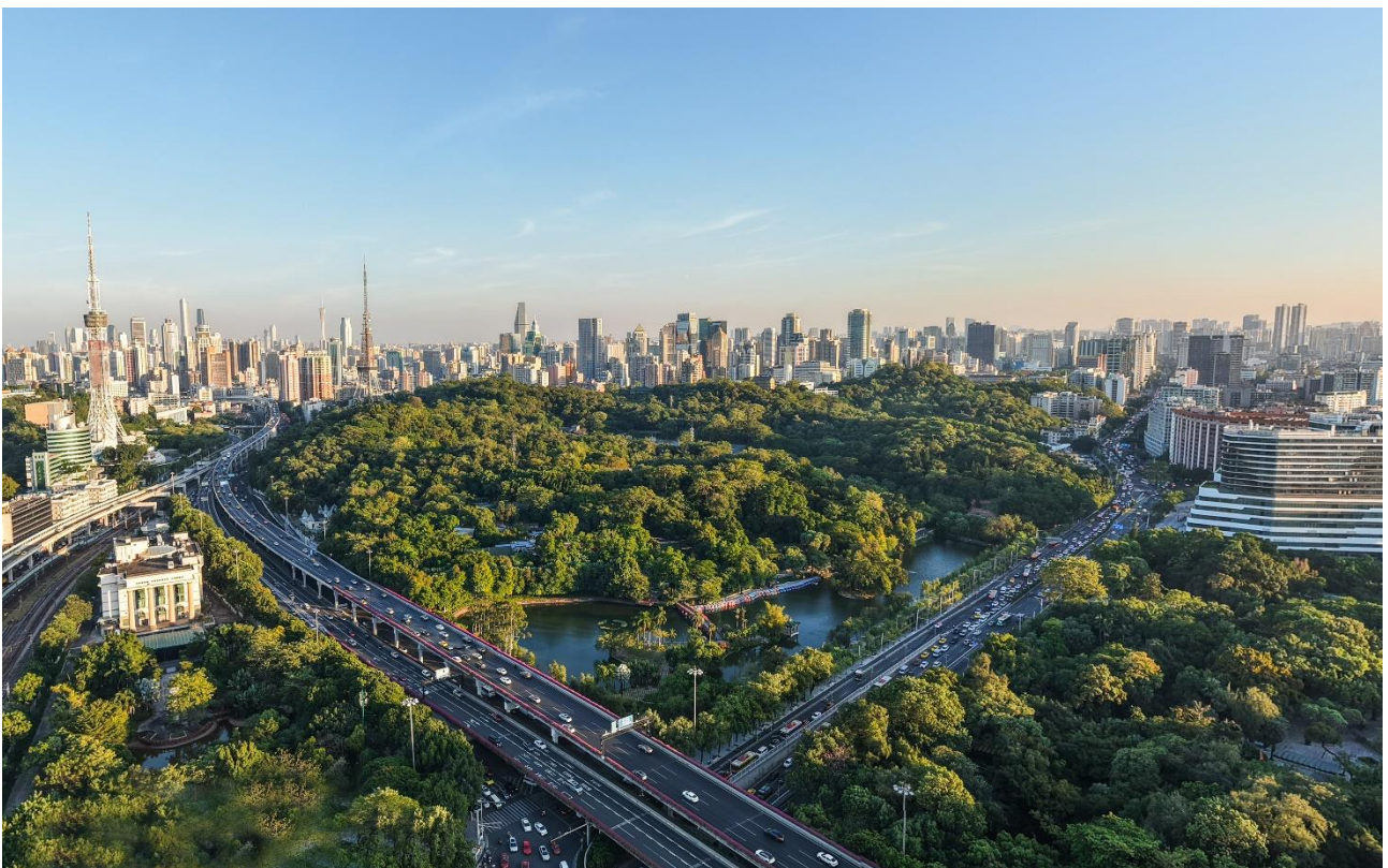
广州市越秀公园项目

普邦设计以广州市越秀公园的绿色本底为基础，通过优化改造园内不合理的人工林、次生林与景观林，提升了重点区域的森林景观风貌、整体布局和生物多样性。项目精心打造了绿色与彩色交融、景观镶嵌分布、季相丰富、层次分明的多彩森林景观，有效提升了城市文化品位，彰显了普邦设计对城市公园生态价值与美学价值的深刻理解与精湛实现。