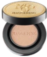
奢華魚子無瑕氣墊粉底液 Luxury Caviar Flawless Cushion Liquid Foundation

為滿足消費者從妝前護理到定妝和修容的全套日常妝容需求，我們推出了全套的粉底系列，包括妝前乳、遮瑕膏、粉底、定妝粉和腮紅。具體而言，我們的粉底產品採用精選成分配比，打造適合消費者的自然持久妝感的乳霜質地。下文載列我們的代表性粉底產品：