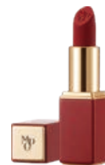
絲柔雅致唇膏 Silky Elegant Lipstick