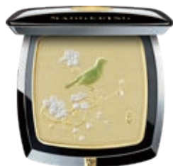
暗香疏影凝顏粉餅

Fragrance And Shadow Wear Pressed Powder