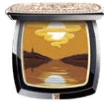
秋水皓月多用眼彩盤 Lakeside Moonlight Multi- Purpose Eyeshadow Palette