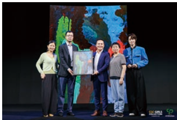
毛老師出席公益拍賣現場圖片