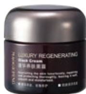
奢華養膚黑霜Luxury Regenerating Black Cream