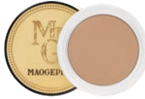
柔光收顏粉膏 3D Shadow Compact Powder