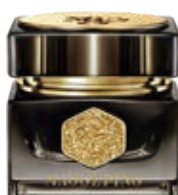
黑金煥顏御齡眼霜 Premium Nutritive Anti- aging Eye Cream