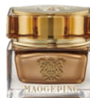
奢華至臻面霜Luxury Time-Inverse Recovery Cream