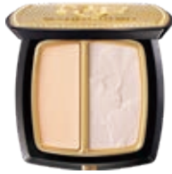
光影塑顏雙質高光盤 Radiance Sculpting Duo Highlight Palette