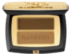
塑形雙色眉影粉 Sculpture Duo Eyebrow Powder