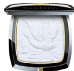
鶴舞翩躚駐顏蜜粉餅

Calligraphy And Bamboo Charming Dual Color Highlight Palette