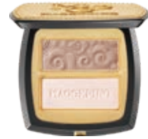
光影塑顏立體鼻影粉 3D Light Nose Bridge Lifting Palette