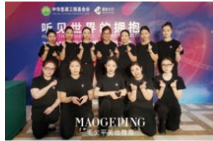
「愛的分貝」2024聽障行業發展與交流大會