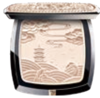
舒雲暮汐雙色高光粉餅 Cloud and Tide Highlighting Pressed Powder