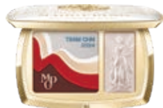
盛彩之光藝術眼彩盤 Splendid Aura Artistry Eye & Cheek Palette