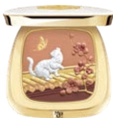
御貓嬉戲多用眼影盤

秉持將傳統文化植入現代審美及當代時尚的理念，我們的「氣蘊東方」系列已經升級到第五代，是我們與故宮文創攜手打造的產品系列。該系列將豐富的東方元素優雅地融入現代美學理念，巧妙地將故宮博物院的百年傳承和傳統東方美學精髓融入產品之中。作為MAOGEPING在東方美學領域的巔峰之作，氣蘊東方系列精心雕刻產品，用產品驗證文化，用文化反哺成長。該系列憑藉對東方文化的詮釋和化妝技術的巧妙融合，贏得了廣泛讚譽和忠實的品牌擁護者。以下載列我們的「氣蘊東方」系列的代表性產品：