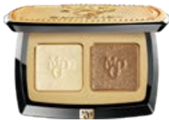
塑形晶彩眼影 Sculpture Bright Eyeshadow

我們推出了一系列精選眼妝產品，包括眼影、眼線筆和睫毛膏，以滿足客戶不斷變化的美妝偏好。我們的眼影提供多種珠光和啞光效果，色彩豐富多樣，適合不同的化妝風格和場合，可呈現富有創意及個性化的眼妝。此外，我們還推出了除黑色以外多種顏色的眼線筆，以滿足消費者對更加鮮艷多彩的眼妝效果的需求，從而激發日常化妝中更多富有創意的自我表達。下文載列我們的代表性眼妝產品：