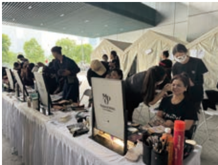
2024超級模力秀「錦秀芳華」時尚盛典