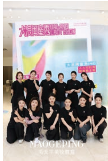
人人可時尚我有我主張—大浪閨蜜秀