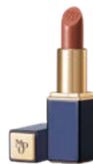
魅色凝潤唇膏 Allure Moisturizing Lipstick