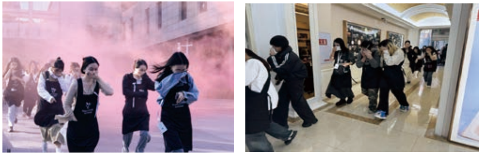
毛戈平學校開展消防演練

我們的《實驗室管理制度》中明確針對實驗室環境，包括化學藥品、儀器設備、人員操作和廢氣處理等方面作出了詳細規定，避免在實驗過程中造成人員損傷或資產損失。在消防安全方面，我們已在各個校區實施《消防安全應急預案》，規定了責任分工、火災預防、現場處置、後期處理、應急物資、培訓與演練等全方面措施。本年度，毛戈平學校在北京、深圳、上海、成都、青島等多個校區開展消防演習與培訓活動，提升全體師生的火災風險意識與自防自救能力，保障師生的生命財產安全。