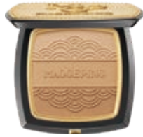
光影塑顏三色修容餅 3D Light Three-color Shading Compact