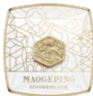
盛彩之光瑞龍凝採粉餅 Splendid Aura Auspicious Dragon Radiance Pressed Powder

「盛彩之光」是毛戈平美妝與中國國家隊於本報告期內推出的聯名系列產品，其名稱源自於一個獨特的洞察：雖然東西方審美略有差異，但美感都是來源於最深層的熱愛，其美麗展現的形式都是自我的表達與態度的綻放，所以，只有遵循自己熱愛、勇敢表現自己的人，才能在賽場上釋放閃耀世界的「盛彩之光」，毛戈平美妝將中法城市文化地標、競技精神元素、運動員的颯爽身姿融合成花窗圖案，透過東西方的「花窗」，看見更美的「光影」。以下載列我們的「盛彩之光」系列的代表性產品：