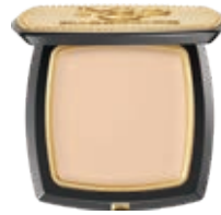
光感美肌無痕粉膏 Luminous Perfect Cream Foundation