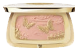
晴春蝶戲漫彩胭脂

Frolicsome Royal Kitty Eyeshadow Palette