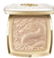
盛彩之光瑞龍凝採粉餅 Splendid Aura Luminous Highlighting Powder