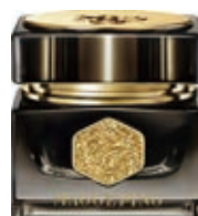
黑金煥顏輕潤面霜 Premium Nutritive Light Moisturizing Cream