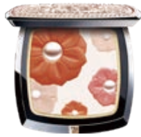
淺妝蓮韻柔採腮紅 Light Lily Gentle Glorious Blusher

毛戈平美妝與亞運聯名禮盒靈感出自宋代詩人蘇軾的詩句「欲把西湖比西子，淡妝濃抹總相宜」，以杭州最具代表性的「水文化」為創意主題，蘊含著對世界的歡迎以及對未來的期許。禮盒中的各個單品皆取自傳統元素與杭城美景，結合亞運氛圍，如搖曳蓮花、西湖月夜、錢塘江潮汐、祥雲圖騰及龍騰浪潮，無一不承載著東方美學的細膩表達，更是對杭州亞運會的獻禮。毛戈平美妝以熱情誠摯的心意，譜寫下杭州「一方水韻」以及「杭州亞運會」的精美回憶。以下載列我們的「亞運禮獻」系列的代表性產品：