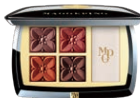
點絳蓮兮燦顏唇粉盤

Fragrance And Shadow Wear Pressed Powder