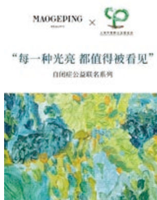
以拍賣的公益畫作《納豆庭院》為靈感設計MGP公益護手霜包裝

毛戈平先生攜手毛戈平MGP品牌與上海市曹鵬公益基金會達成公益合作共識、以共創公益產品的形式助力自閉症公益。毛戈平MGP品牌以毛戈平先生所拍得的自閉症兒童畫作為公益護手霜產品設計靈感，藉助產品將自閉症兒童創作的美帶給更多消費者，希望以微光之力，讓更多的人看見自閉症群體及其家庭。同時，品牌會將公益產品的部分收入捐獻給基金會、用於長期支持基金會的自閉症公益事項。