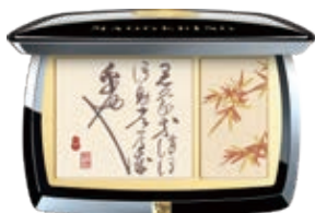
翰墨賦竹傾顏雙色高光盤

Sunny Spring with Flying Butterfly Rouge