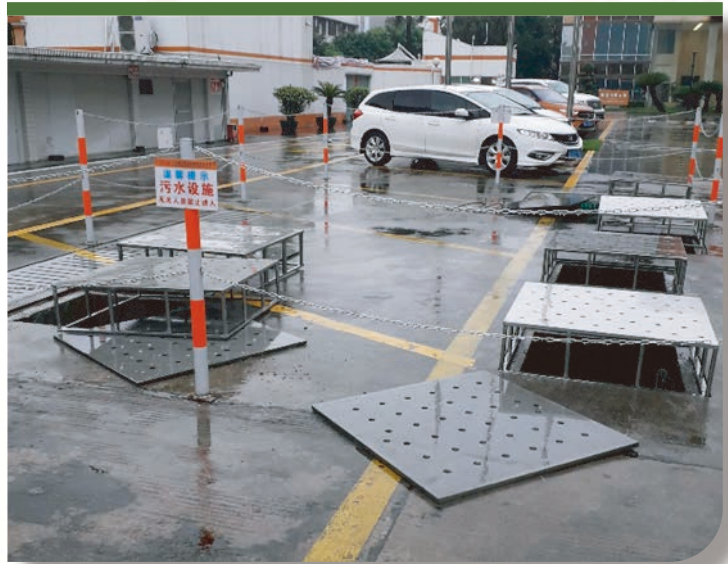
污水沉澱池(左)和污水設施(右)