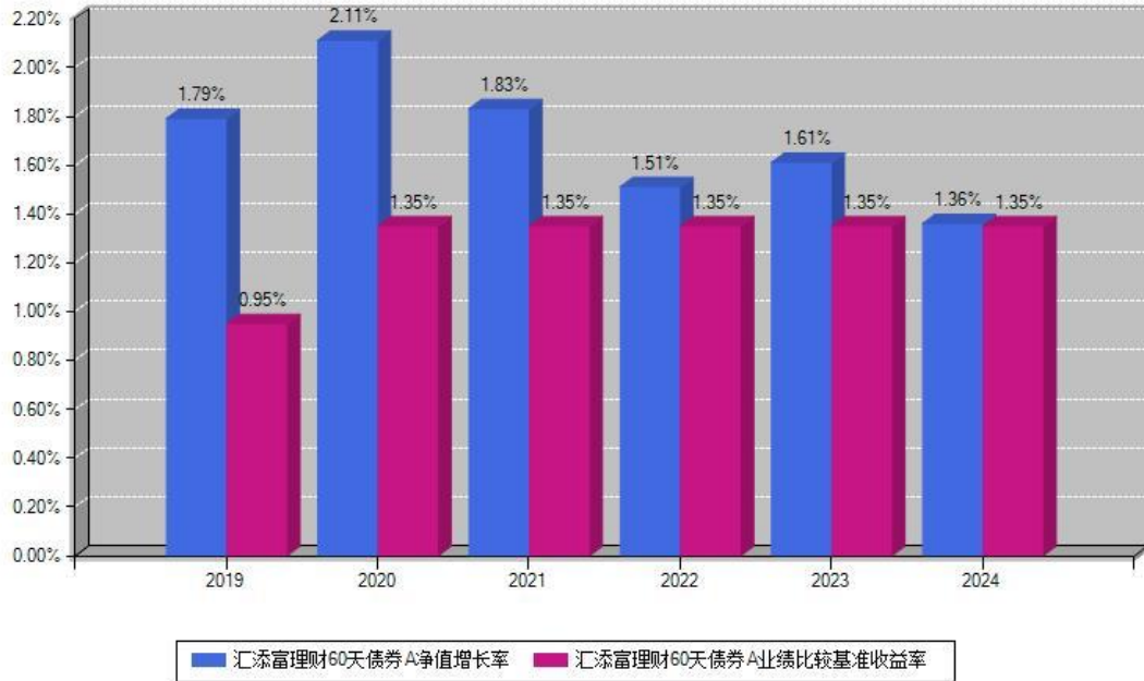
汇添富理财60天债券A每年净值增长率与同期业绩基准收益率对比图

注：数据截止日期为2024年12月31日，基金的过往业绩不代表未来表现。本《基金合同》生效之日为2019年04月18日，合同生效当年按实际存续期计算，不按整个自然年度进行折算。