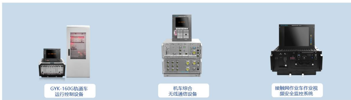
GYK-160G轨道车 运行控制设备