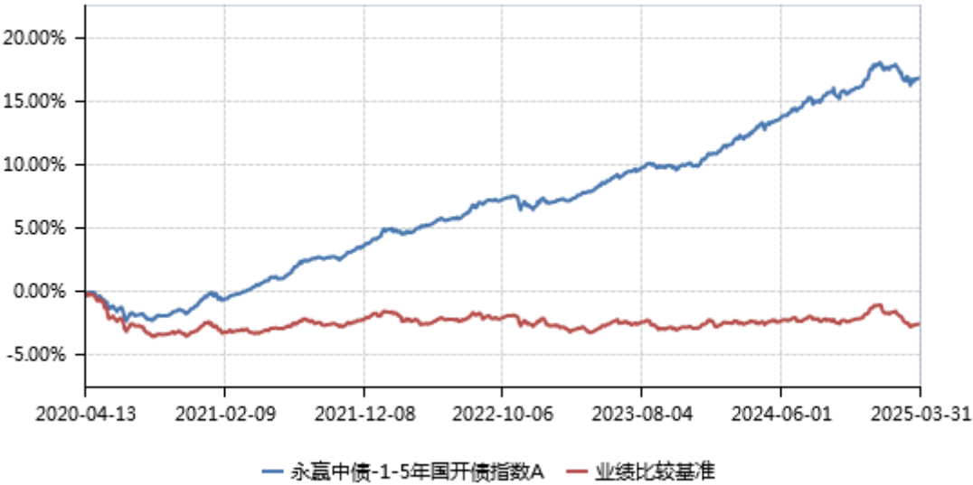
永赢中债-1-5年国开债指数A累计净值收益率与业绩比较基准收益率历史走势对比图 ( 2020年04月13日-2025年03月31日 )