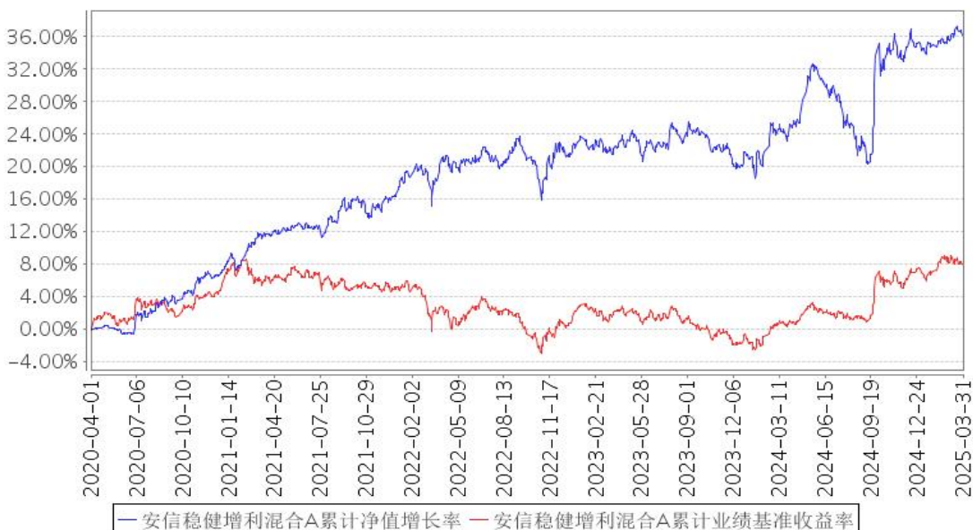
安信稳健增利混合A累计净值增长率与同期业绩比较基准收益率的历史走势对比图