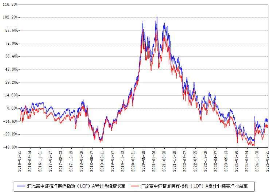
汇添富中证精准医疗指数（LOF）A累计净值增长率与同期业绩比较基准收益率对比图