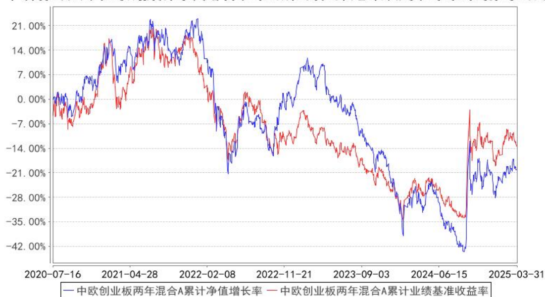
中欧创业板两年混合A累计净值增长率与同期业绩比较基准收益率的历史走势对比图